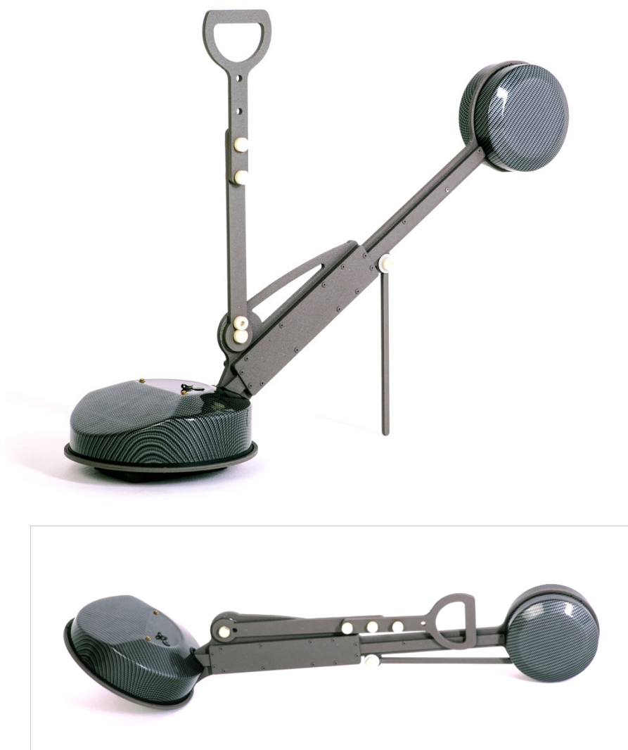
Рис. 1 Геовизер v.3

3.12. Исполнение прибора брызгозащитное, не герметичное.